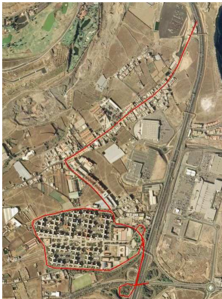
Recorrido La Pardilla – Las Remudas

Observaciones: no existe restricciones de tráfico de viajeros tanto en trayectos internos (entre la C/Raimundo Lulio y la C/Mesonero Romano) como en trayectos externos (entre la C/Raimundo Lulio o la C/Mesonero Romano con las paradas situadas entre Las Remudas y la Estación San Telmo). Los viajeros correspondientes al tráfico interno estarán sujetos a compensación a determinar según los datos de la cámara de compensación.