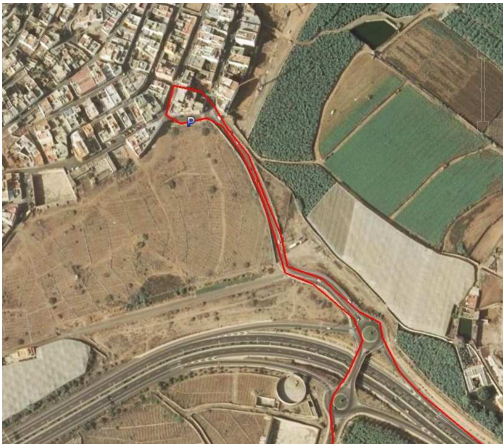
Recorrido en La Atalaya de Guía

Observaciones: Existe prohibición de tráfico de viajeros internos (entre La Atalaya y Gáldar, entre La Atalaya y Guía y entre La Atalaya y el Cruce de la Atalaya). No existe restricciones de tráfico de viajeros en trayectos externos (trayectos no definidos como internos). No obstante, la configuración de los servicios para la conexión de La Atalaya de Guía con Las Palmas de Gran Canaria queda sujeta a una posible reestructuración tras la terminación de la nueva infraestructura viaria.